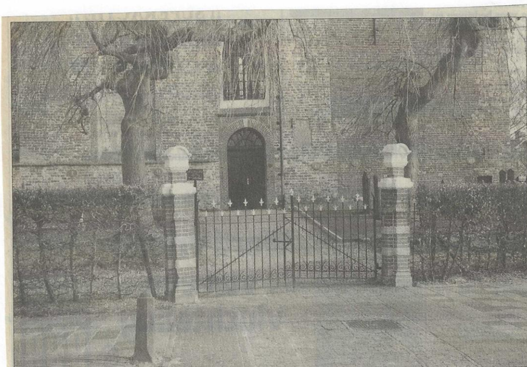
Ingang oude dorpskerk aan de Kerkstraat te Buitenpost.