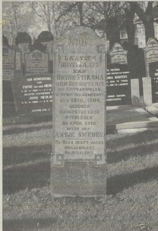
Grafsteen Bonne Stikma op het kerkhof te Buitenpost.

Door Dirk R. Wildeboer te Buitenpost Secretaris van de Stichting Oud-Achtkarspelen